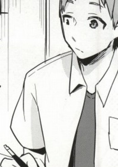
▲ あのとき、ゆきおのパソコンで印刷した

尻でやるとか 聞いてねえよ… 第一うんこしか 出し入れしない ような場所に ちんこ突っ込む とか